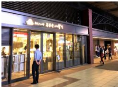
上野駅店(エキユート)