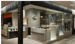
東京駅売店(エキユート)