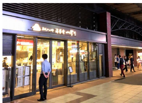
上野駅店(エキキュート)