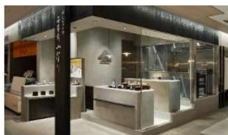
東京駅売店(エキキュート)