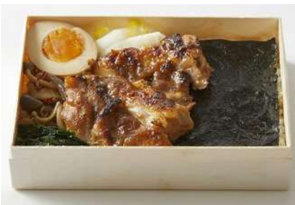
海苔弁 山 1,080円(税込)

山の幸をメインにした海苔弁。鶏の照り焼きは、時間が経っても柔らかくお召し上がりいただけるよう塩麴を揉みこんでいます。生姜がアクセントになっているので、食べ飽きずに最後までお召し上がりいただけます。舞茸、しめじ、えのき、つきこんにゃくをりんご酢でじっくり煮絡めたきのこのりんご酢煮はさっぱりとした一品。箸休めには、ゆず大根を。