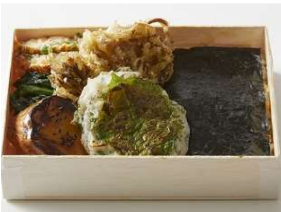
海苔弁 畑 1,080円(税込)

畑の幸を存分に楽しめる海苔弁。メインの惣菜はれんこん大葉もち。昆布茶と塩というシンプルな味付けに、大葉の香りとれんこんの食感を楽しめる一品。香り豊かな舞茸の天ぷら「畑」ならではのおかずです。ほくほくのジャガイモにバターを利かせたマッシュポテト、デザート感覚で楽しめる甘みの強い安納芋を使った大学芋もお召し上がりいただけます。