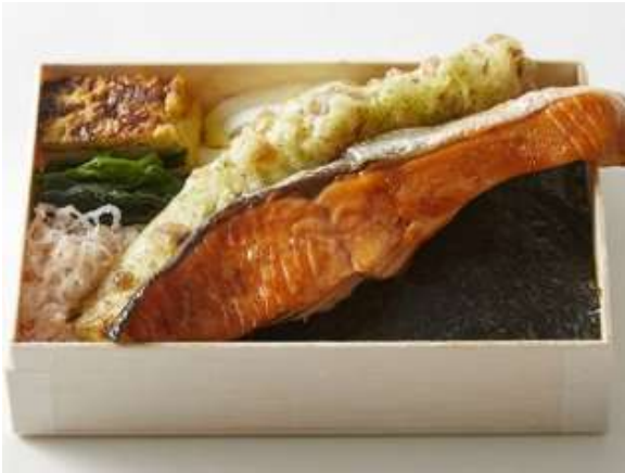
海苔弁 海 1,080円(税込)

海の幸をメインにした海苔弁。脂ののった鮭は、弁当箱からはみ出るほどの大きさ。そして、海苔弁の定番のおかずといえば、ちくわの磯辺揚げ。その長さも他ではなかなか見られません。“家庭料理の最上級”を目指し、玉子焼きにはあえて焦げ目を入れています。懐かしさと優しさを感じていただける一品です。